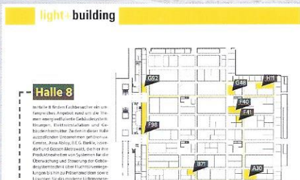
Seite 15 Guided Tour Light + Building