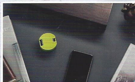
Seite 36 Funkbasiertes Smart-Home-System